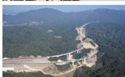
新名神高速道路 大津ジャンクション 滋賀県大津市 / 2008年