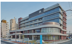
大和高田市新庁舎 奈良県大和高田市 / 2021年