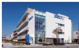
兵庫県立粒子線医療センター 附属神戸陽子線センター 兵庫県神戸市 / 2017年