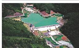
兵庫県三宝ダム建設 兵庫県春日町 / 1995年