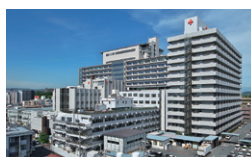
日赤和歌山医療センター新本館 和歌山県和歌山市 / 2012年