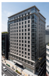
堂島ホテル 大阪府大阪市 / 2021年