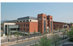
同志社大学今出川キャンパス新棟 京都府京都市 / 2013年