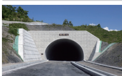
原松原線補助都市計画街路 滋賀県彦根市 / 2023年