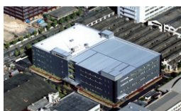
島津製作所新W3号館 京都府京都市 / 2006年