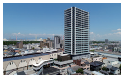
羽衣駅前再開発 大阪府高石市 / 2019年