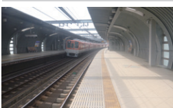
阪神本線鳴尾駅付近 連続立体交差(第2工区) 兵庫県西宮市 / 2018年