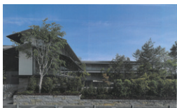
福田美術館 京都府京都市 / 2018年