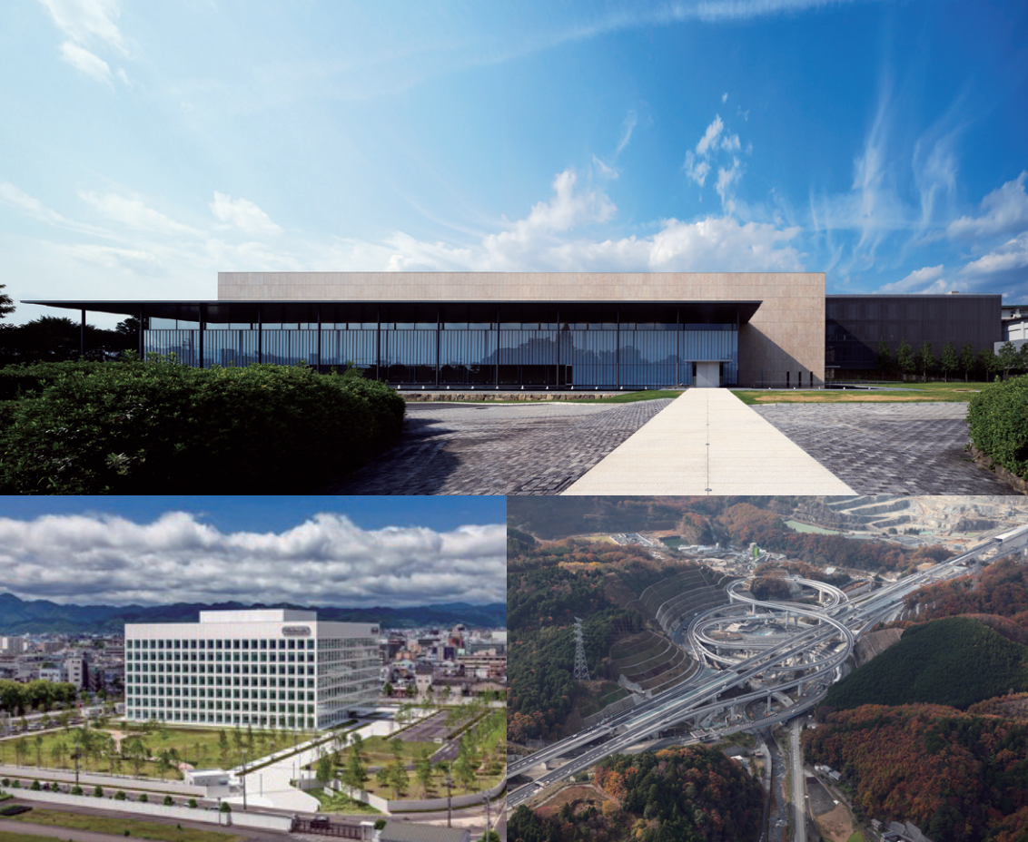
上：京都国立博物館平成知新館（京都府京都市 | 2013年）／下左：任天堂本社開発棟（京都府京都市 | 2014年）／下右：新名神高速道路箕面インターチェンジ（大阪府箕面市 | 2017年）